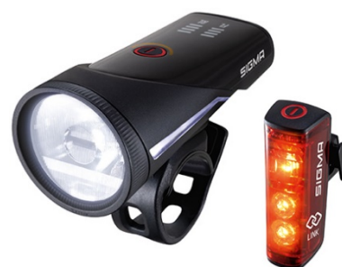
AURA 100 / BLAZE LINK