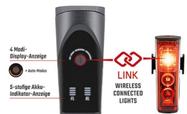
AURA 100 / BLAZE LINK

Der Helligkeitssensor schaltet bei entsprechendem Umgebungslicht automatisch das Rücklicht ein und wieder aus. Das spart Akku und ist ideal zum Beispiel beim Passieren von Tunneln oder dunklen Waldwegen. Die Rückleuchte BLAZE wurde im vergangenen Jahr von der Stiftung Warentest mit der Note 1,7 zum Testsieger unter den Fahrradrückleuchten gewählt. Im AURA 100 / BLAZE LINK Set können sowohl AURA 100 LINK als auch BLAZE LINK separat mit allen Features genutzt werden.